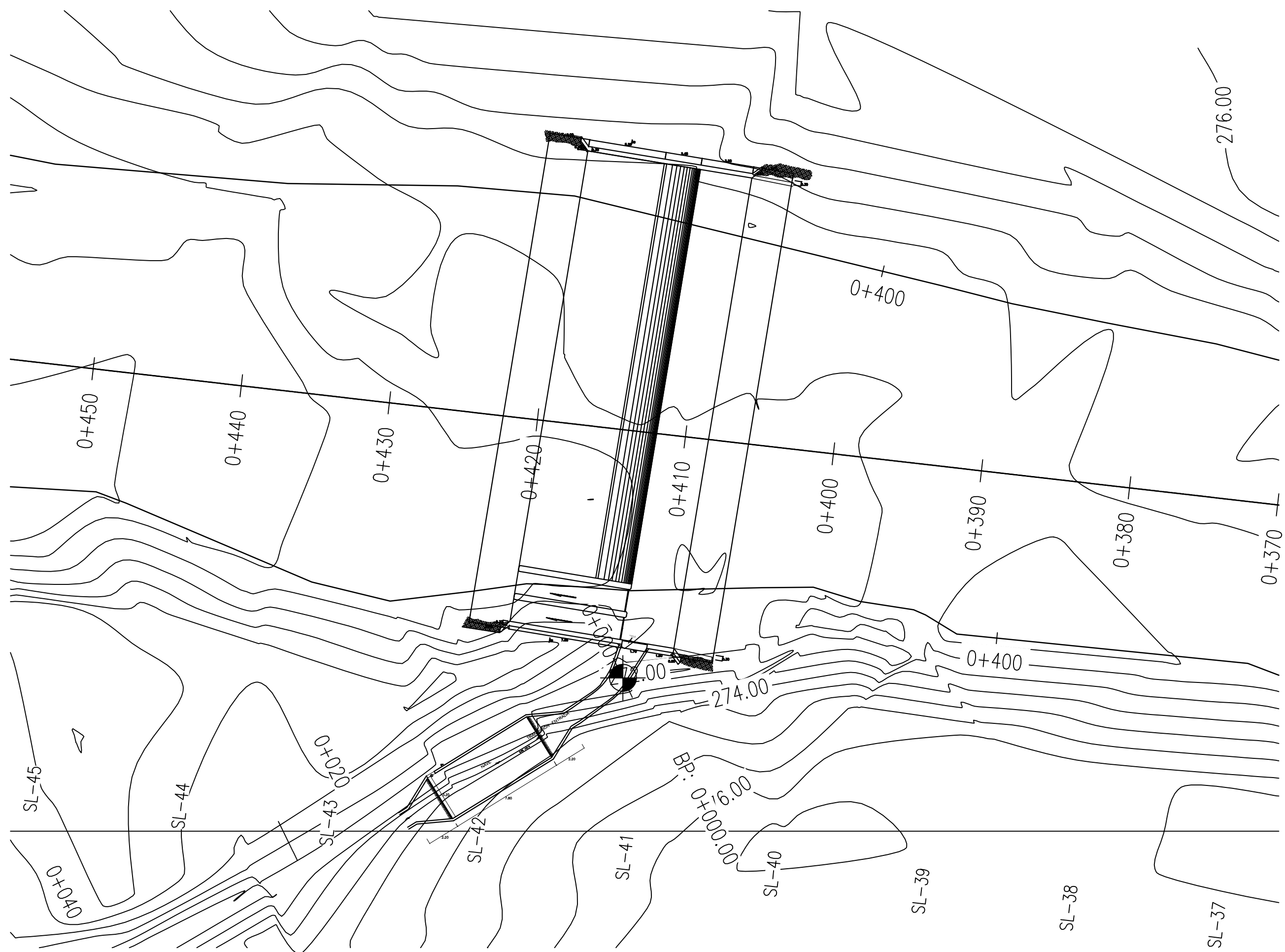
PLANO DE PLANTA Esc. 1/500